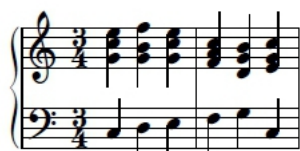
6a) I V_3^4 I^6 IV V I

Kottapélda: a szerkesztési elveknek megfelelő V_3^4 \rightarrow I^6 váltásra a 6a, a Mozart-kvintpárhuzamra a 6b. Figyeljük meg, hogy a Mozart-kvintlépés után sokkal simább, kevesebb ugrást igényel az akkordvezetés, mint a terckettőzött egy-szextre való szabályos vezetés után! Az 1c példában pedig a hét-szükszeptimről az első fokra való továbblépésnél elkerülhetetlen a Mozart-kvintpárhuzam.