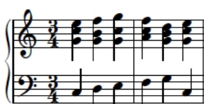
6b) I V_3^4 I^6 IV V I

Ugyanakkor az érzékeny hangok kettőzésének tilalma miatt (lásd a 2.6 definíciót és kiegészítő pontját) több szextakkordfajta csak terckettőzött formában engedélyezett. Ilyen például a hét-szext: a VII. fokú hármás minden hangnemben szűk, és mivel alapja a vezetőhang, az nem szerepelhet két szólamban, tehát az alaphelyzetű akkordot és az alapkettőzött szextfordítást eleve el kell vetnünk a klasszikus összhangzattan